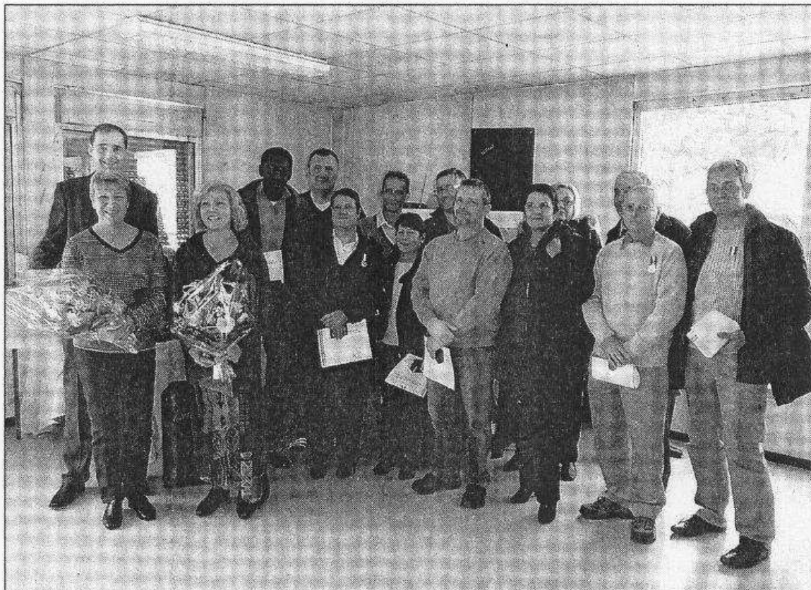
Le directeur, les onze médaillés, 2 d'or (35 ans de service), 8 de vermeil (30 ans) et un d'argent (20 ans), posent avec les trois retraités